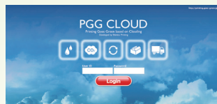
印刷サービスCO 2 排出量算定ソフトウェア PGG-CLOUD

印刷物のライフサイクルにおけるCO 2 排出量を、印刷サービスCO 2 排出量算定ソフト「PGG-CLOUD」にて算出、日本WPAでの検証を受け、日本WPAとカーボンオフセット・プロバイダーを通じて同等量のクレジットを購入・オフセット(相殺)することで、印刷物のCO 2 排出量を実質ゼロにします。